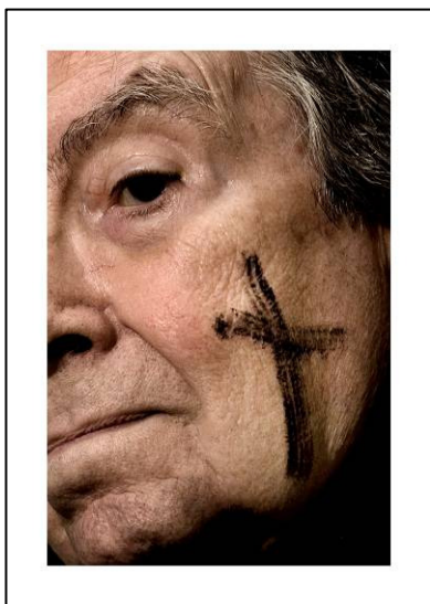
Antoni Tàpies, artista. Barcelona, 2009