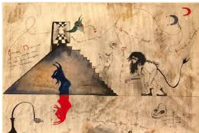
Joan Ponç, guaix dedicat a Joan Brossa (1950)

Joan Ponç (Barcelona, 1928-Sant Pau, Alps Marítims, 1984), pintor d'avantguarda de la postguerra, va fundar entre altres artistes el grup Dau al Set. Fins al 4 de febrer de 2018 s'ha pogut veure a La Pedrera de Barcelona una extraordinària mostra del seu geni.