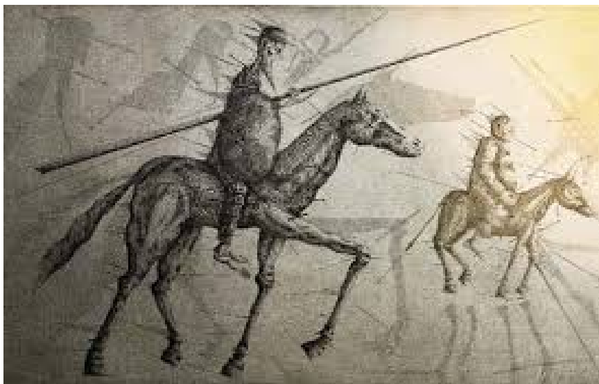
Joan Ponç, Visiones del Quijote, 1979