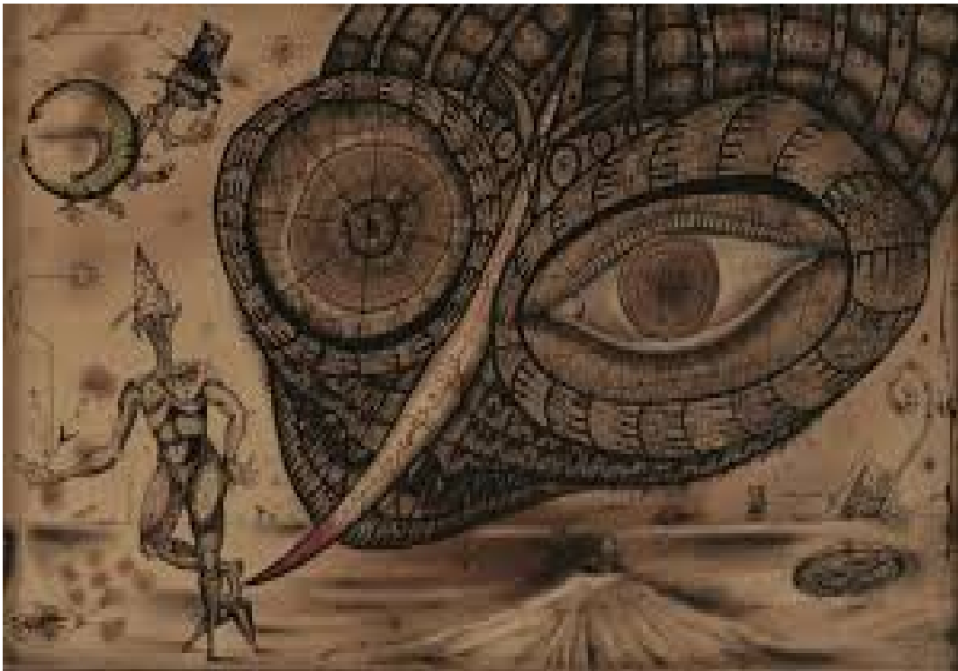
Joan Ponç, La mosca, 1948