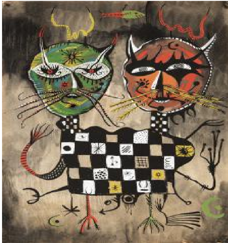
Joan Ponç, Savis al capvespre, 1947