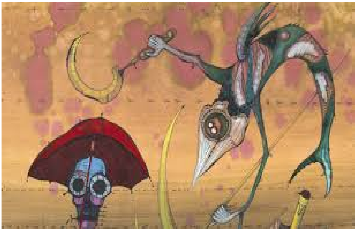
Joan Ponç, Suite Fons de l'èsser, 1975-1979