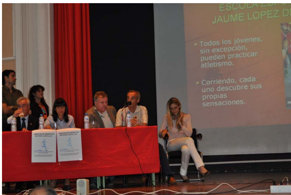
Un altre moment de la presentació de l'Escola d'Atletisme Jaume López de Egea